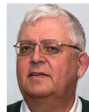
CALLE FRIEDNER TEXT OCH FOTO

Det är nog ganska okänt att det funnits en sådan här omfattande notsamling på ett av våra järnbruk. Särskilt spännande är förstås musiken av de anonyma eller mycket lite kända tonsättarna. En del musik kanske inte är av den kvaliteten att den haft kraft att överleva, men musiken på den här skivan är inte bara mycket väl framförd utan håller också i sig själv hög kvalitet. Det är med andra ord med spänning och nyfikenhet man lyssnar på den här skivan med högklassig barockmusik, som måste ses som kammarmusik med tanke på de få instrumenten den framförs på. Sedan må den kallas ”Konsert” eller ”Uvertyr”.