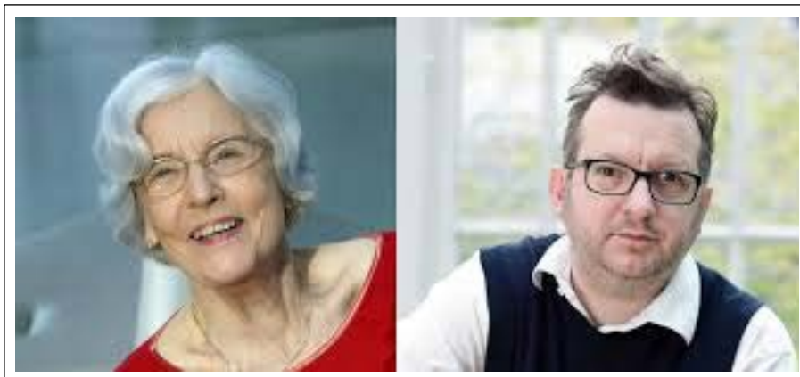
Betsy Jolas och Mark-Anthony Turnage.