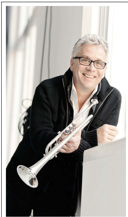
Håkan Hardenberger.

Podiet på klubben är placerat precis framför fönstren till köket, där man då och då ser jäktade kockar vifta förbi. Själv sitter jag uppflugen på en barstol med den imponerande baren och en mängd besökare mellan mig och musikerna. Men personalen är beundransvärt tyst och koncentrationen i publiken