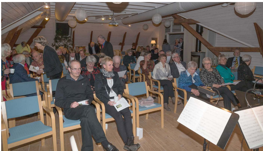
Den talrika publiken blev inte besviken.