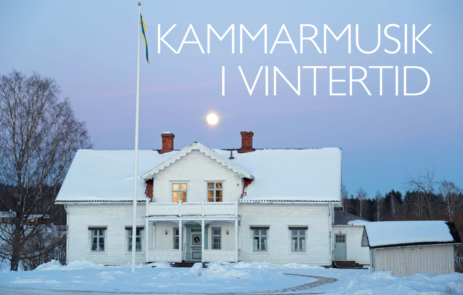
Mangårdsbyggnaden på Sahlströmsgården i mäsken.